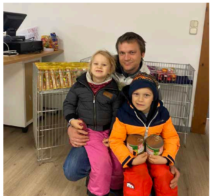
Danke an Kleinspender für die wertvolle Unterstützung