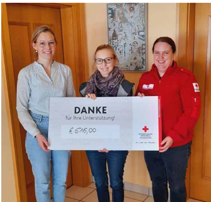
Paketaktion in Edlbach erbrachte € 616,-.