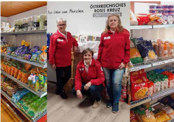
Karte schon beantragt