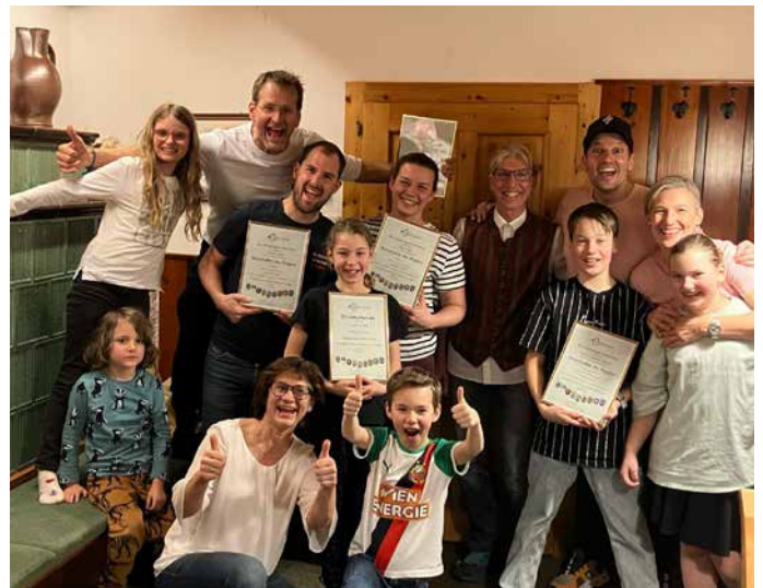
Große Gästeehrung am Ferienhof Gressenbauer